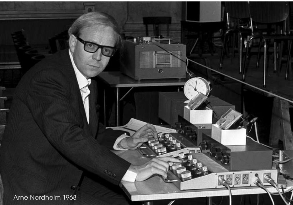
Arne Nordheim 1968