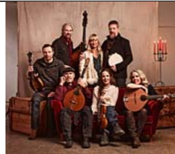
Favoritt: Jul i Folkton

Siden dette skrives i advent: Liveplaten med Jul i Folkton er det jeg trenger nå. Svenske folkemusikere gir deg julen så stille og inderlig.