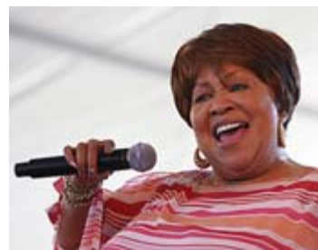
Favoritt: Mavis Staples.

Soul møter gospel møter produsenten Jeff Tweedy fra Wilco som den rutinerte Mavis Staples til nye høyder. Dette er himmelsk bra!