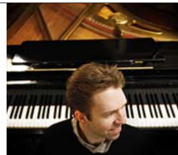
Favoritt: Leif Ove Andsnes.

Leif Ove Andsnes er selv stolt av denne innspillingen, med all grunn. Igjen viser han oss veien til nye rikdommer i en av de store pianokonsertene.