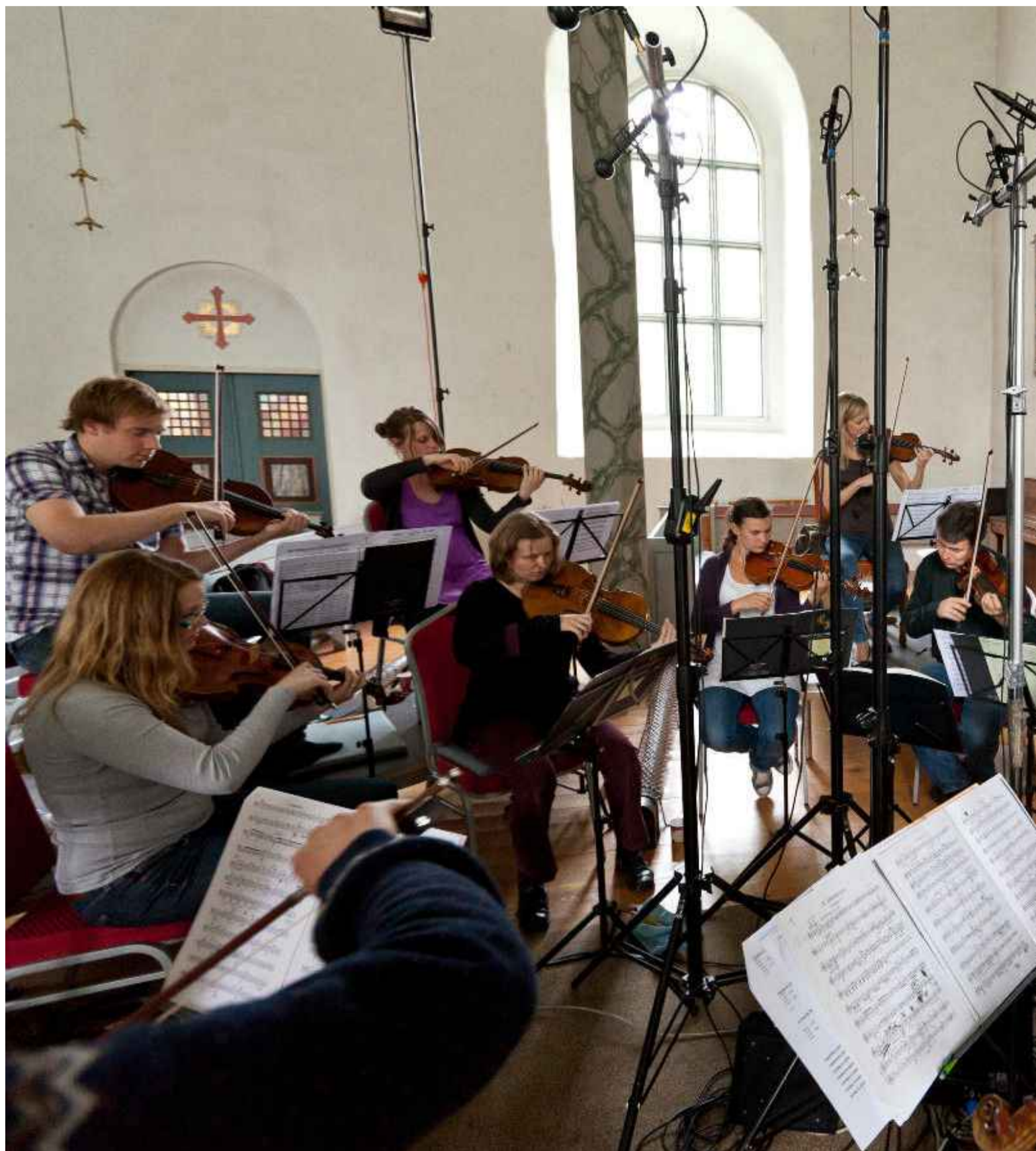
VINYLINNSPILLING: Plateselskapet 2L er kjent for sin digitale lyd, men har nå gjort sin første innspilling for LP-plate med Trondheimsolistene i

– Jeg oppdaget at det klang på en veldig god måte. Jeg ble veldig glad i det jeg opplevde i vinylen. Nå er det ja takk, begge deler. Høyoppløst til sitt bruk, og vinyl til sitt. Men jeg kan ikke analysere hva det er som skjer. Det er snakk om harmoniske forvreng-