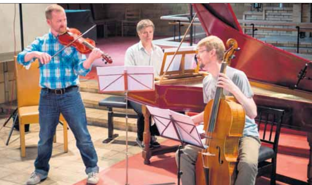
MENING, LIV OG VARIASJON: Vår anmelder er begeistret for «Secondo Natura».