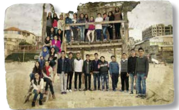
Gaza Ungdomskor synger med stolthet og innlevelse.