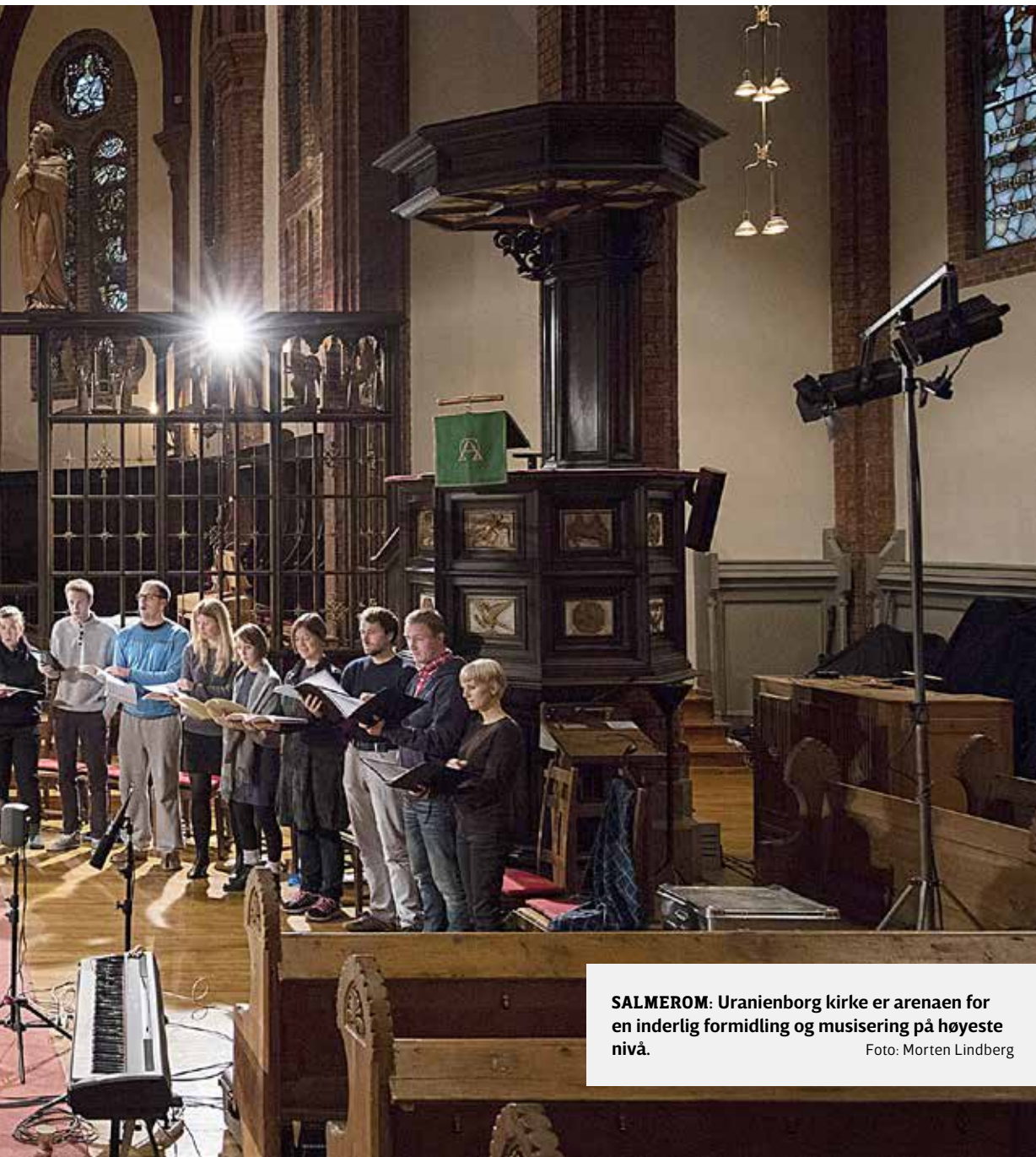
SALMEROM: Uranienborg kirke er arenaen for en inderlig formidling og musisering på høyeste nivå.