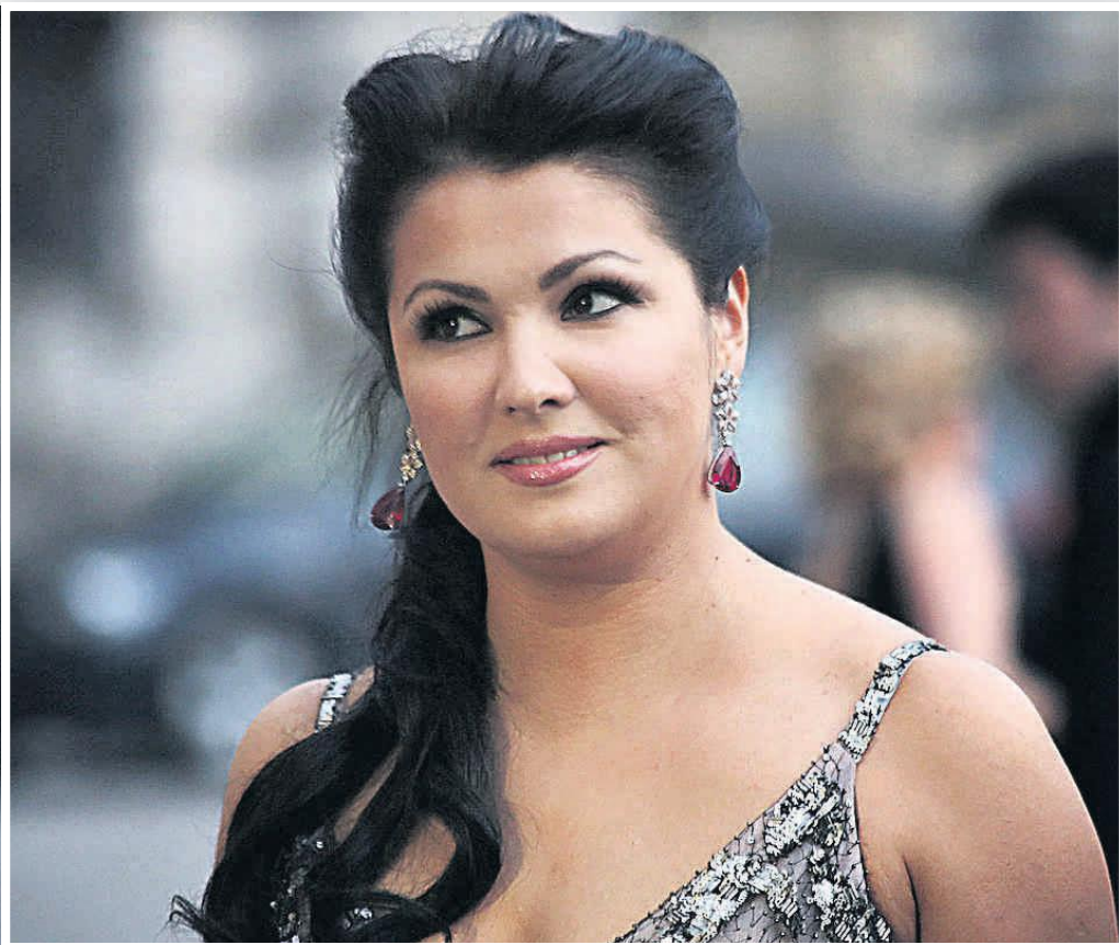
DIVA SÅ DET HOLDER: Anna Netrebko har for lengst tatt skrittet over i klassen for operafagets ekte divaer.

Romantiske toneganger dominerer denne ukas platespalte.