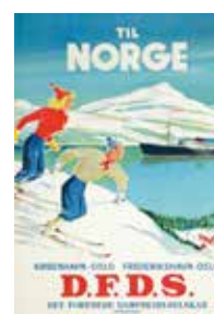
Plakat med ukjent opphavsmann.

og med det første vinter-OL i Chamonix i 1924 og fremover.