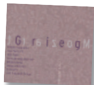
Mozart/Grieg Klaversonater – bearbeidelse for 2 klaver Dena Piano Duo 2L40/Musikkoperatørene