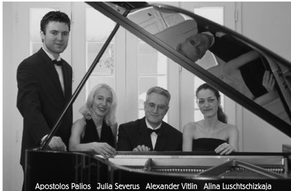
Apostolos Palios Julia Severus Alexander Vitlin Alina Luschtschizkaja