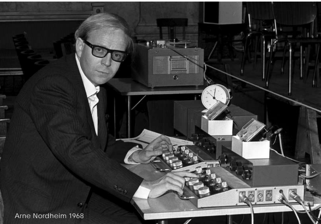
Arne Nordheim 1968