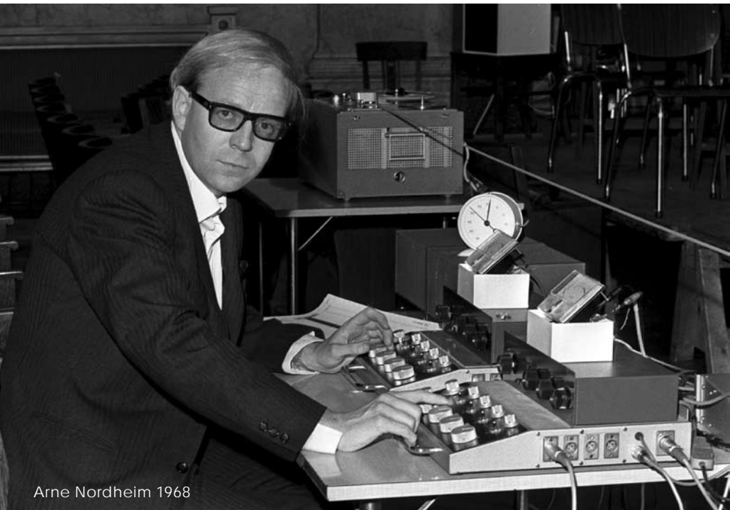
Arne Nordheim 1968