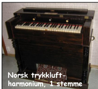
Norsk trykkluft- harmonium, 1 stemme