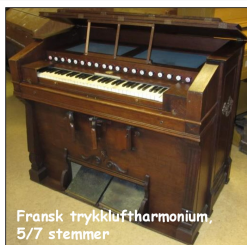
Fransk trykkluftharmonium, 5/7 stemmer