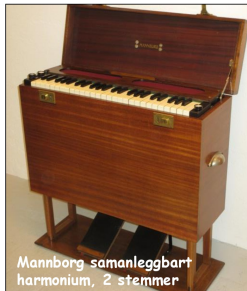
Mannborg samanleggbart harmonium, 2 stemmer