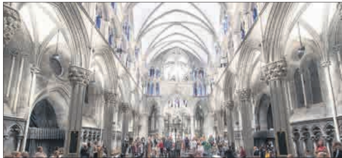
I DOMEN: Pene innspilingsforhold i Trondheim.