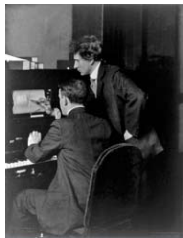
△ Grainger 監督 Duo-Art 紙卷剪輯製作 - 1915 年

感依然勝過 stereo。順便一提：Rex Lawson 主理的專題網址 pianola.org 有最詳盡的 piano rolls 資料。