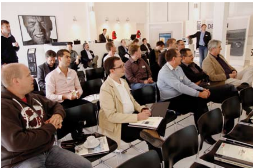
De fleste hi-fi skribenter fra Skandinavia var samlet på lydseminar i København