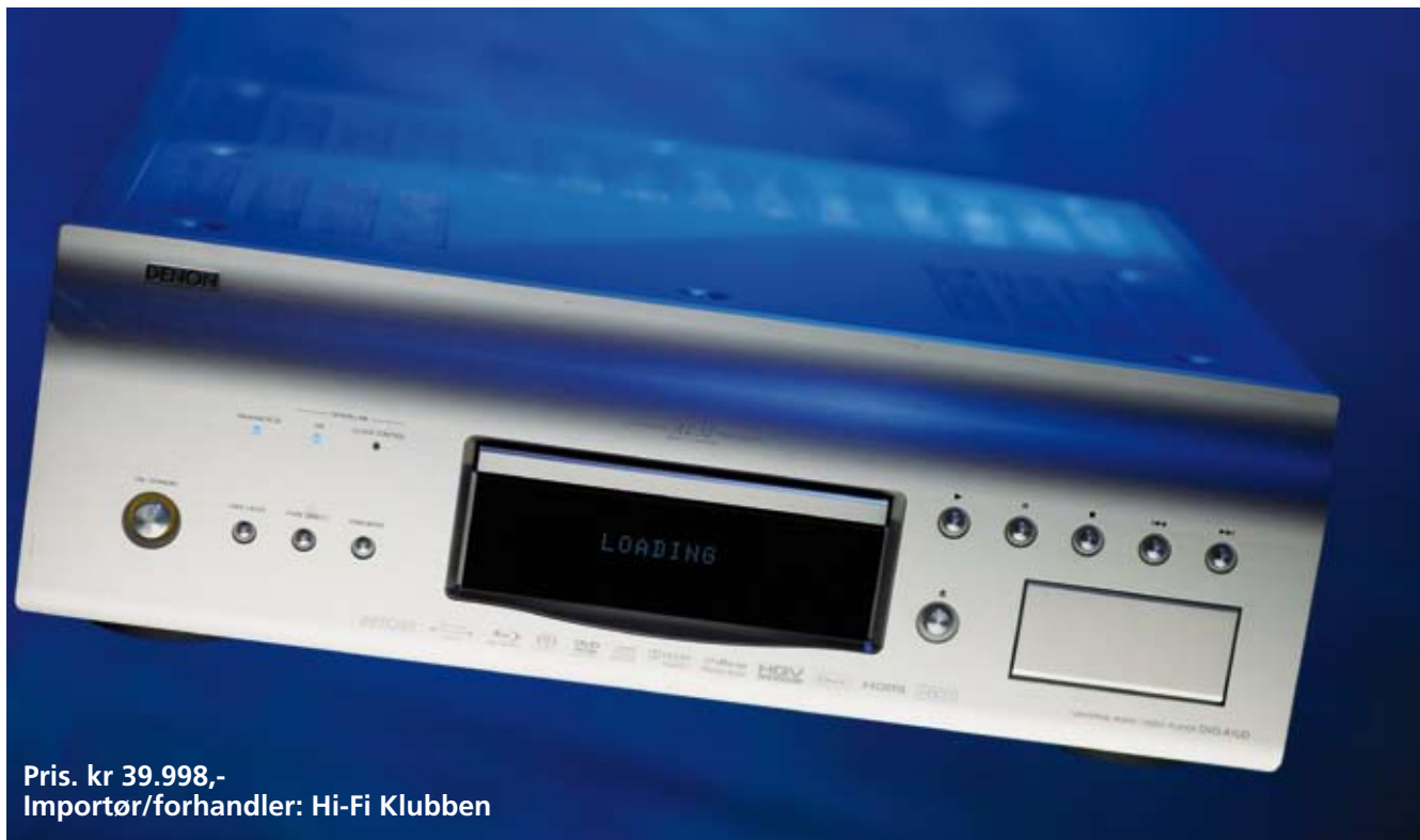
Pris. kr 39.998,- Importør/forhandler: Hi-Fi Klubben

Griegs A-moll konsert har hatt uvurderlig betydning. Og det ikke bare som et gjennombrudd for den unge bergenser som ikke så seg anlediget til å overvære den kongelige premiere i København. Her ble den øyeblikkelig en kjempeslag, for å si det slik, og etablerte den unge musikklereren som da bodde i Oslo som en av verdens mest berømte komponister.