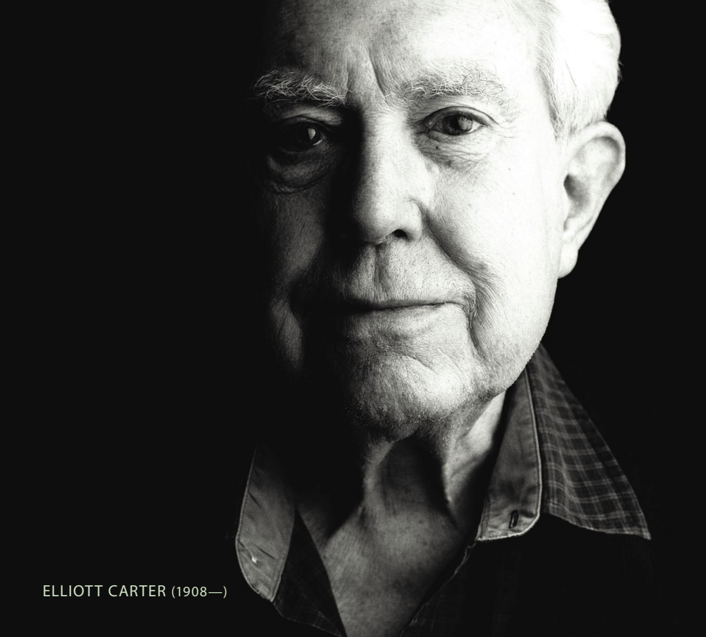
ELLIOTT CARTER (1908—)